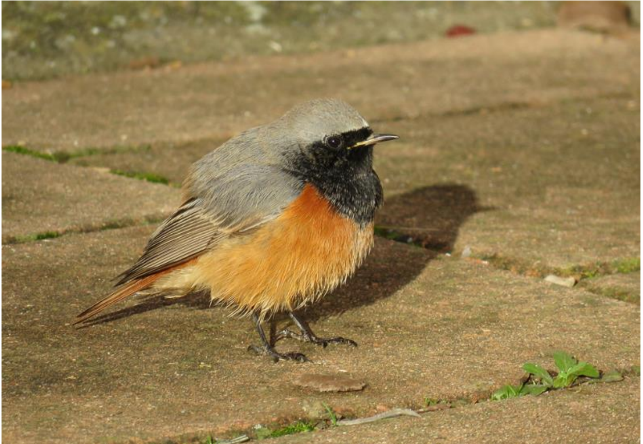
Oosterse zwarte roodstaart in Smitshoek