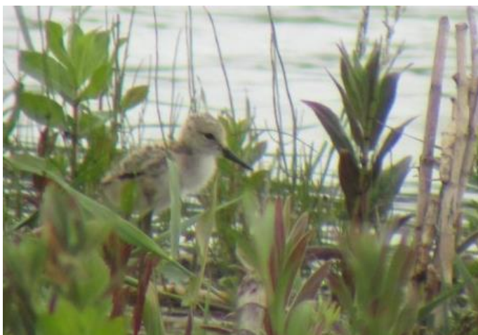
Foto 13 Een jonge steltkluut in Waalbos van enkele dage oud .

Zoals gebruikelijk was juni een stille maand. Desondanks begon het eigenlijk fantastisch, toen op 2 juni drie jonge steltkluten uit het ei kropen in Waalbos (foto 13 & 14). Het broedgeval was geslaagd!