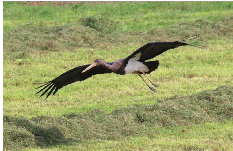
Foto 16 Een zwarte ooievaar was kort ter plaatse bij Zwijndrecht.

zilverreigers zijn in augustus weer een stuk algemener geworden, maar duiken in de Crezéepolder maar sporadisch op. Daarentegen wordt een tweetal in Waalbos gezien van 4 tot 12 augustus en duikt op 4 augustus ook nog een tweetal op in de Zuidpolder. Op 10 en 11 augustus vliegt nog een exemplaar over Polder Sandelingen. Deze plek is ook eindelijk weer eens het decor van een zeldzame soort, namelijk een waterrietzanger die op 10 augustus wordt ontdekt en tot 13 augustus aanwezig blijft (foto