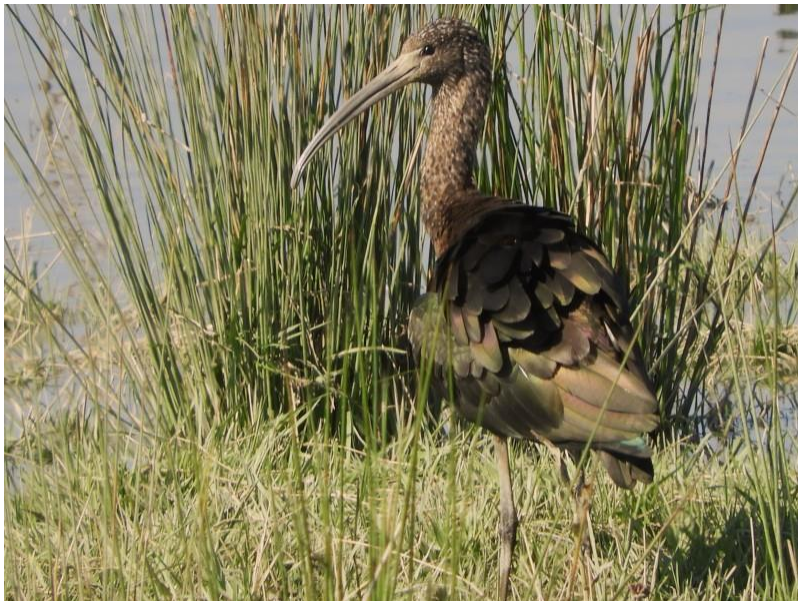
Foto 9 Op 10 mei verbleef kort een zwarte ibis in de Crezéepolder.

De eerste twee weken van mei werden erg veel zeldzame en soorten op IJsselmonde gezien. Zelfs twee nieuwe voor het eiland! De maand begon op de eerste dag dan ook gelijk al goed met een draaihals die vanaf 30 april in Polder het Buitenland van Rhooen zat, twee zingende fluiters in het Zuiderpark, een overvliegende zwarte wouw bij Rijsoord en waarschijnlijk acht stelkluten tegelijk op IJsselmonde. Een zestal werd gezien in Waalbos, terwijl nog steeds twee exemplaren in de Crezéepolder rondhingen. Het zestal van Waalbos waren overduidelijk doortrekkende exemplaren, aangezien ze kort daarvoor in de Zuidpolder werden gezien. In de Crezéepolder werd het paartje tot 3 mei gezien, terwijl ook een paartje (van het zestal) in Waalbos bleef hangen. Dit paartje is een broedpoging gaan ondernemen, waarbij rond 10 mei op de eieren is gekropen. Het feit dat het aantal aangroeide naar drie exemplaren op 13 mei en uiteindelijk vier op 17 mei, wees erop dat er toch nog werd rondgezworven in de buurt. Zo dook op 22 mei ook plotseling weer een exemplaar in de Crezéepolder op en werd op 26 mei een exemplaar in de Zuidpolder gezien. Uiteindelijk resteerde