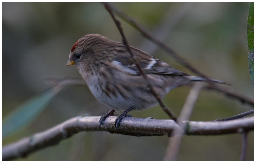
Foto 23 Eén van de twee kleine barmsijzen in Polder de Hooge Nesse.

Naast deze invasieve vinkachtige deden ook de