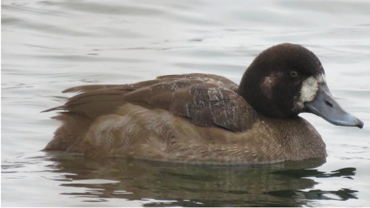
Foto 2 Vrouwtje topper in het Waaltje bij Rijsoord

mees werd gezien in Barendrecht en H.I.Ambacht. Ook meeuwen kregen weer de nodige aandacht, wat leidde tot overwinterende zwartkopmeeuwen in H.I.Ambacht (voor zijn tweede winter), het Zuiderpark (2kj) en Charlois. Geelpoot- en pontische meeuwen waren wat schaarser dan vorige winters met maximaal resp. één en vier in Rotterdam-Zuid. Ook langs de rivieren werden nog enkele exemplaren gezien. Twee roerdampen bij de Heinenoordtunnel kregen deze winter overigens ook veel aandacht, ze waren soms erg mooi te zien! Een velduil in de Rhoonse grienden, een witkopstaartmees in Zwijndrecht en een invallende rode wouw in de Portlandpolder waren nog enkele schaarsere wintergasten, maar bleken niet twitchbaar. Ten slotte waren waarnemingen van een lepelaar op 25 januari in Polder Oud-Reijerwaard en twee overwinterende bruine kiekendieven in de Crezéepolder nog opvallend voor de tijd van het jaar, terwijl zwarte roodstaarten , roodborsttapuiten , oievaars , witte kwikstaarten , kneuen en tjiftjaffen tegenwoordig gebruikelijke overwinteraars zijn.