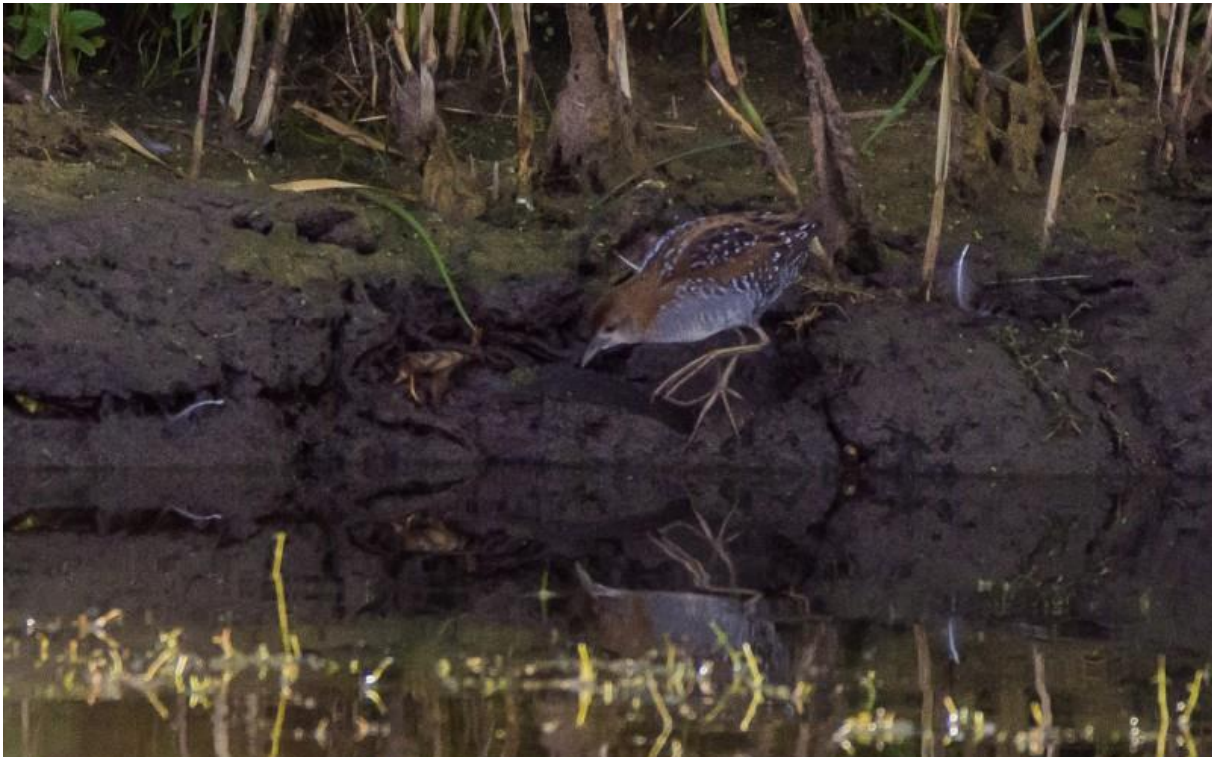
Foto 20 Een kleinst waterhoen verbleef op 19 september in het Waalbos.

rietperceeltje ophield en zich dus erg goed liet bekijken (foto 20). Een primeur voor IJsselmonde! De volgende dag bleek de vogel gevlogen. Vanaf die periode zette ook een kleine invasie van zwarte mezen door en rond 25 september werden overal over het eiland wel groepjes gemeld. Een tweetal boomklevers die op 5 september bij het Weetpunt opdoken hadden niet per se wat met het najaar te maken, maar de baardmannetjes (tot acht exemplaren) in Polder Sandelingen waren wel duidelijk doortrekkers. Tegen het eind van de maand doken wel weer meer 'oktobersoorten' op zoals op 29 september een grote pieper over de Crezéepolder, terwijl op die dag ook een oeverpieper ter plaatse was. Op de 30 ste , de EuroBirdwatch, zaten waarschijnlijk zelfs drie oeverpiepers kort ter plaatse en was bij Polder de Hooge Nesse ook een velduil ter plaatse. Tevens vloog daar een drietal appelvinken over, waarvan op 28 september ook een tweetal over Heerjansdam werd opgemerkt. Op 22 september was een waarneming van een tweetal casarca's over de Crezéepolder het noemen waard en op de 20 ste keerde de buffelkopeend weer terug op de Gaatkensplas.