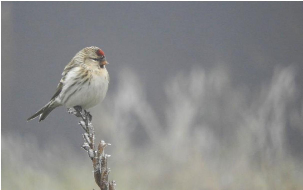
Foto 24 Een witstuiarmsijs verbleef enkele dagen op een ruig terrein in H.I.Ambacht langs de Rietbaan

Op de eerste dag van december bleek nog steeds een buidelmees ter plaatse in Crezéepolder. Vermoedelijk zat hij er al vanaf oktober. Ook de rest van de maand werd hij regelmatig gezien en