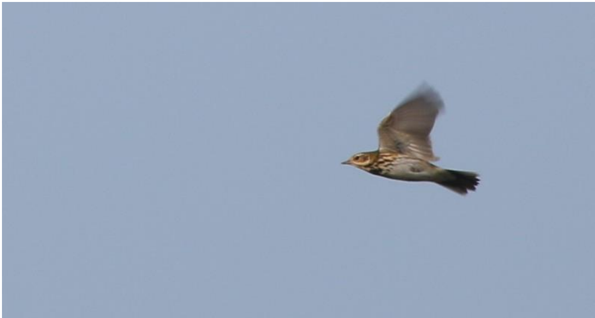
Foto 22 Een Siberische boompieper was op 16 oktober kort aanwezig in de Crezéepolder.

baardmannen , resulterend in tellingen met 18 (9 oktober), 31 (12 oktober) en 25 exemplaren (17 oktober). Hiervan bleven ook enkele exemplaren ter plaatse hangen in de rietkraagjes, zoals een buidelmees dat ook deed vanaf 14 oktober tot het einde van de maand. Verder zaten de gehele maand weer tot zes bokjes in de Crezéepolder, hielden tot twee oeverpiepers zich op langs de Noord en was op 10 oktober nog een zwarte ruiter ter plaatse. Wat de Crezéepolder betreft leverde die uiteindelijk ook de beste soort op voor oktober. Op 16 oktober was namelijk een siberische boompieper aanwezig op het ruige veld voor zo'n drie kwartier (foto 22). Het exemplaar liet zich enkel vliegend zien als hij werd opgestoten en riep daarbij veelvuldig, zodat de determinatie achteraf makkelijk was voor deze nieuwe soort van IJsselmonde. Uiteraard was het elders op het eiland ook niet saai, met een mooie bladkoning in Waalbos op 11 en 12 oktober, terwijl op 16 oktober ook nog een exemplaar aanwezig was in het Ruigeplaatbos. Een tweetal beflijsters dat op 8 oktober in Heijplaat werden gezien vormen ook een echte zeldzaamheid op IJsselmonde in het najaar. Een soort