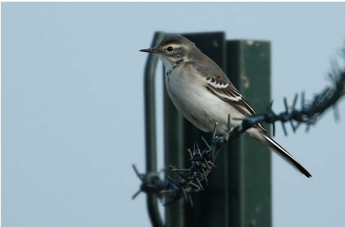
Foto 18 Een 1kj citroenkwikstaart werd kort gezien en gehoord in de Crezéepolder op 25 augustus.