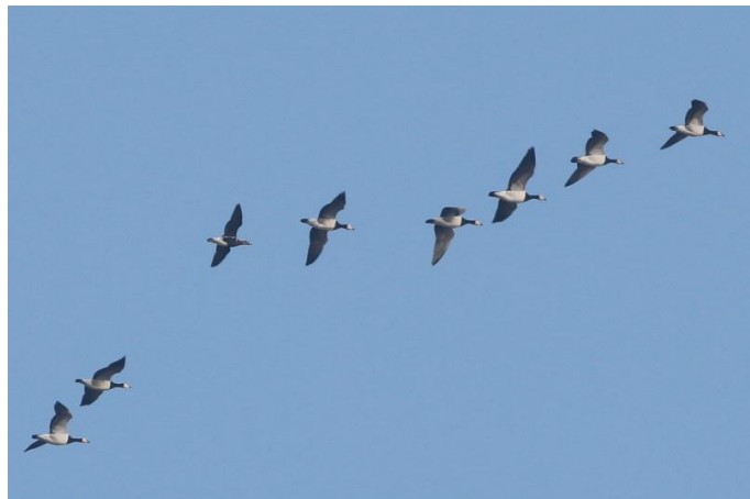
Foto 1. Roodhalsgans tussen de brandganzen over Veerplaat

de jonge generatie, aangezien het de eerste betrouwbare waarneming was sinds 2009. De vogel bleef uiteindelijk tot 6 februari. De beste soort van januari werd wellicht ook wel de beste soort voor 2017. Op 12 januari werd namelijk een oosterse zwarte roodstaart gezien in Smitshoek (foto voorpagina). Op 14 januari werd de vogel weer teruggevonden, waarna hij alleen nog op 15 januari in de wijk is gezien. De vogel was opvallend tam en hield zich op in de kleine voortuintjes van een aantal straten. Het betrof pas het achtste Nederlandse geval van deze ondersoort uit het verre, verre oosten. Naast deze erg goede soorten voor het eiland waren er uiteraard ook de meer standaardwintergasten. In Polder Zwaarddijk verbleven weer tot zeven goudvinken , een kleine bonte specht werd af en toe gezien in het Klein Profijt, een enkele appelvink dook op op de standaardlocaties in Rhoon en Bos Valckesteijn, bokjes zaten in Barendrecht, de Crezéepolder, maar ook in de polders van Rhoon, baardmannen verbleven in de Rhoonse grienden en een enkele zwarte