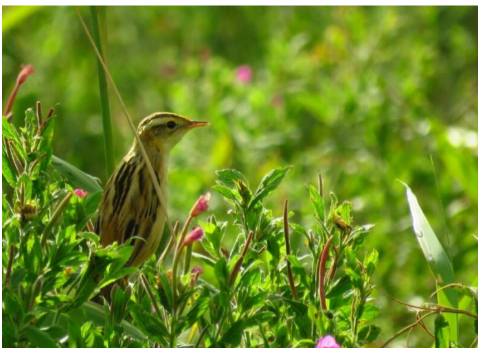
Foto 17 Een waterrietzanger was enkele dagen aanwezig in Polder Sandelingen.

17). Voor het eerst is deze mondiale zeldzaamheid echt twitchbaar op IJsselmonde. Een velduil die op 8 augustus in de Zegenpolder jaagt op de ingerichte vogelakkers van het aldaar ontplooiende experiment is wellicht voor de tijd van het jaar een grotere zeldzaamheid. De eerste helft van de maand levert qua echte zeldzaamheid overigens nog een overvliegende grauwe kiekendief op 11 augustus over Zwijndrecht en een steenloper op 13 augustus in de Crezéepolder op. Verder zijn het de zomertalingen die tot het eind van de maand met max. tien exemplaren in de Crezéepolder zitten, nog een late waarneming van een snor in de Devel op 11 augustus, bosruiters die vanaf 11 augustus nagenoeg de gehele maand in de Crezéepolder worden gezien (tot vijf exemplaren), terwijl