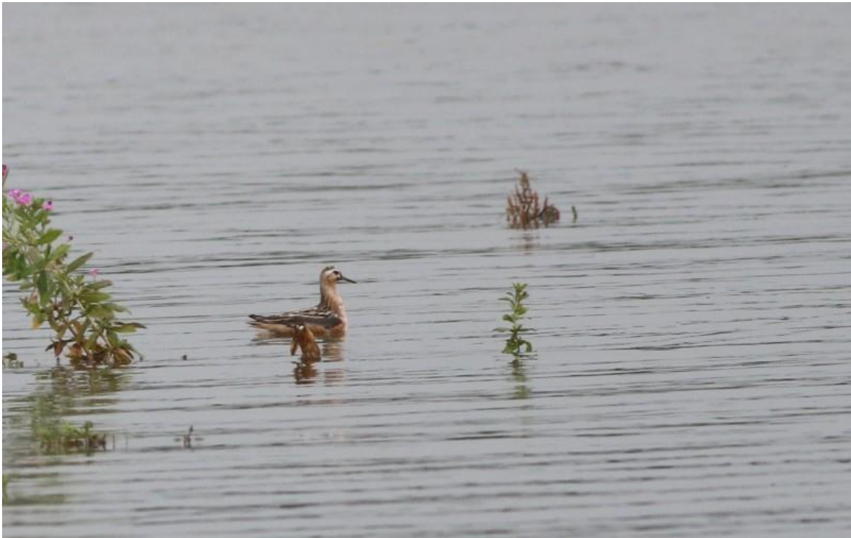
Foto 15 Een mooie rosse franjepoot verbleef enkele dagen in de Crezéepolder.