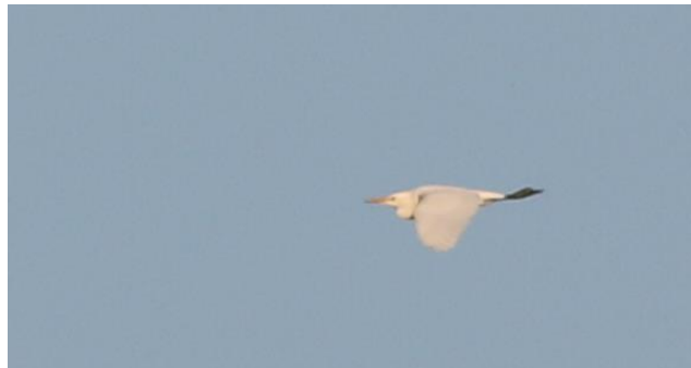
Foto 21 Op 3 oktober vloog een koereiger over de Crezéepolder en later in de maand nog twee.

Oktober werd vooral gekenmerkt door een hoge bezetting van de nieuwe telpost in de Crezéepolder. Dat resulteerde in een flink aantal overvliegende zeldzaamheden. Dat begon op 2 oktober toen 3 zilverplevieren kort ter plaatse waren en ook een velduil inviel in de polder, deze liet zich schitterend zien. Deze werd uiteindelijk tot 9 oktober meerdere malen in de polder waargenomen. Op 2 oktober vloog ook nog een smelleken en zwarte ruiter over, maar de koereiger van een dag later was natuurlijk een stuk beter (foto 21). Een exemplaar van deze soort aan de grond is nog steeds niet gelukt, maar dit is toch alweer het derde geval op IJsselmonde. Alsof dat nog niet genoeg was