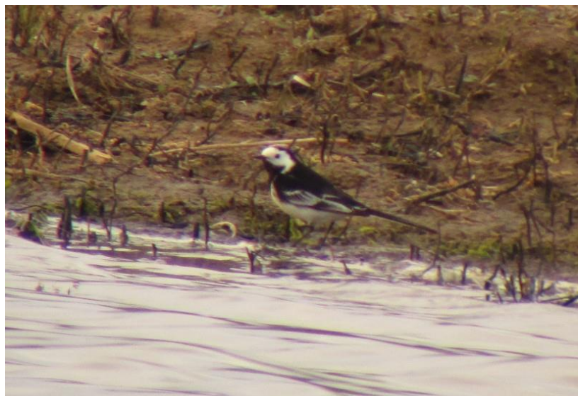
Foto 6 Fraaie man rouwkwikstaart in het Waalbos.

beflijster deed het nog rustig met een enkeling in de Zuidpolder en bij Poortugaal, net als rouwkwikstaarten , waarvan een enkeling opdook bij de Heinenoordtunnel, Polder het Buiteland en in Waalbos (foto 6). Bij de Devel bleken nog twee baardmannen aanwezig en werd op de 31 ste ook de eerste snor weer gehoord. In de Volgerlanden verbleef op 11 maart nog een grote lijster , terwijl in het Klein Profijt tot