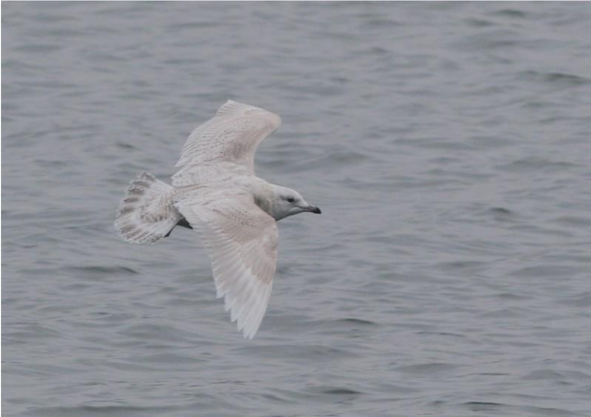
Foto 3 Eerste winter kleine burgemeester in de Maashaven van Rotterdam-Zuid