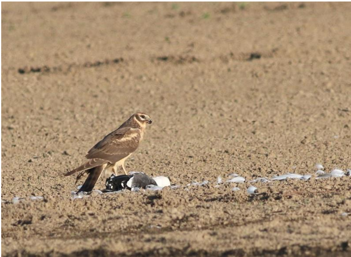
Foto 8 2kj vrouw steppiekiekendief in de Molenpolder op een dode kleine mantelmeeuw.