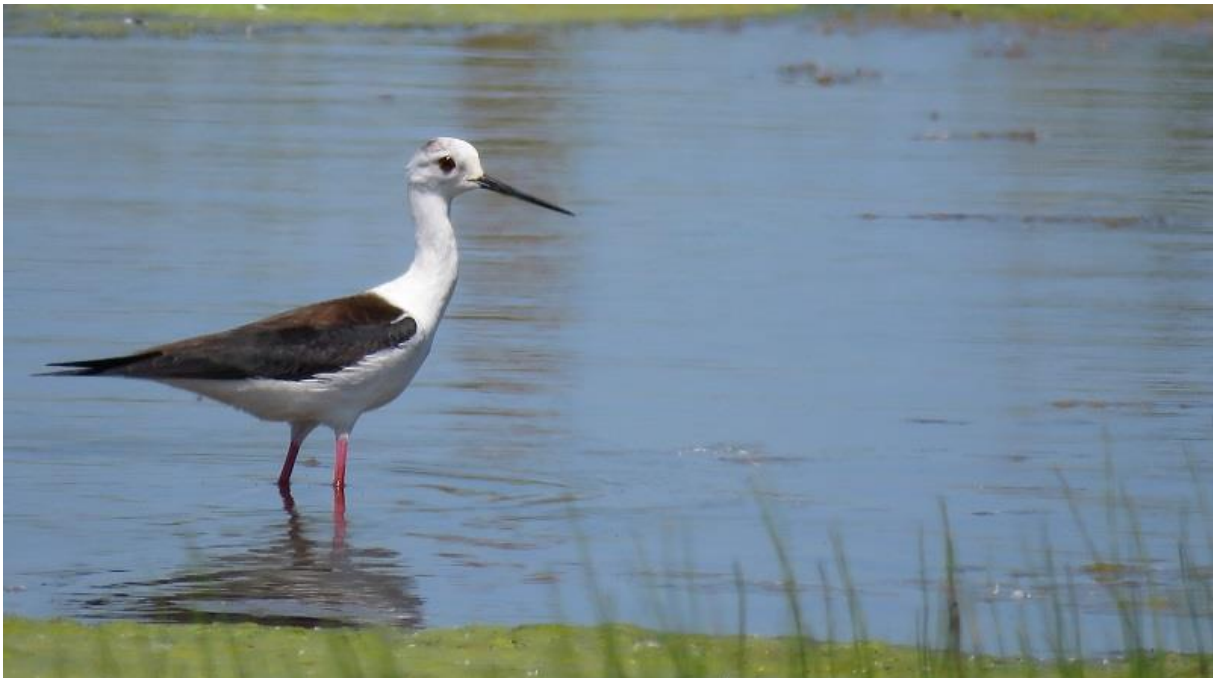
Foto 14 Een oude steltkluut waakt over de jongen in het Waalbos.

kroon spande echter een juveniel exemplaar dat op 10 juni enkele uren ter plaatse was in een conifeer in H.I.Ambacht. Ook appelvinken werden weer geregeld overtrekkend gezien of gehoord, namelijk twee over H.I.Ambacht en enkelen over Bos Valckesteijn. Op 22 juni werd op die locatie ook een goudvink gezien. Een beflijster die op 9 juni in Beverwaard werd gemeld was wellicht, indien correct, de meest opmerkelijke waarneming van de maand. Verder waren het vooral veel standaardsoorten, zoals snorren langs de Devel en nog in de Zuidpolder, pontische en geelpootmeeuwen in Rotterdam-Zuid en langs de rivieren, tot vier zomertalingen in de Crezéepolder en vanaf 15 juni op die plek ook een kleine zilverreiger . Op 21 en 22 juni waren zelfs twee exemplaren aanwezig in de polder, terwijl op 24 juni ook een exemplaar in Polder Sandelingen opdook. De gehele maand was de engelse kwikstaart nog aanwezig in de Portlandpolder, waar dit mannetje samen met een vrouwtje gele kwikstaart enkele jongen wist groot te brengen. Verder kwam er in de tweede helft van de maand weer wat meer leven in de brouwerij omdat de eerste steltlopers weer binnen kwamen. In de Crezéepolder leverde dat naast max. 225 tureluurs en ruim 150 grutto's ook weer de eerste zwarte ruiter en een tweetal bosruiters op. Op 23 juni vloog ook een vroege (of late) wespendief over de Crezéepolder.