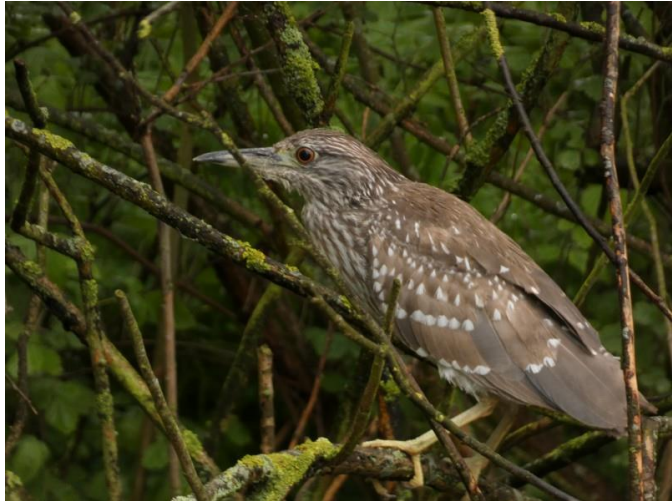
Foto 12 Een kwak verbleef van 13 tot 20 mei rond de Strooppot en de Galgenplaat.

Op die dag werd ook een 2kj kwak gefotografeerd in de Strooppot, die een week later weer werd teruggevonden op de Galgenplaat (foto 12). Daarna werd hij niet meer gezien. Ook werd op 13 mei nog een invallende wielewaal gezien en kort gehoord in de Zuidpolder Buitendijks, terwijl van 20 tot 24 mei een zingend exemplaar in het Develbos verbleef en op 23 mei op de Veerplaat een zingend exemplaar werd waargenomen. Allen waren dit zeer waarschijnlijk doortrekkers. Een goudvink die op 13 mei in Bos Valckesteijn werd gemeld bevestigd wel dat daar zeer waarschijnlijk weer wordt