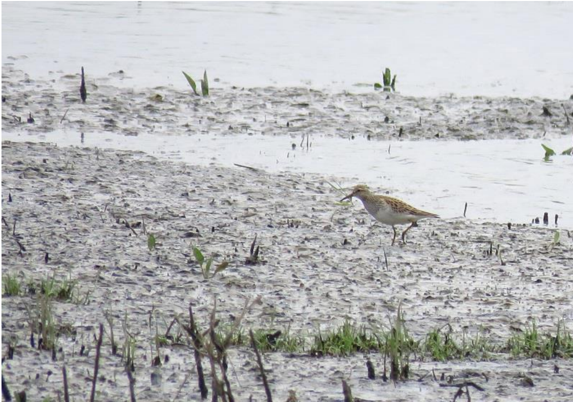
Foto 10 Een gestreepte strandloper was op 13 mei enkele uren aanwezig in de Crezéepolder.