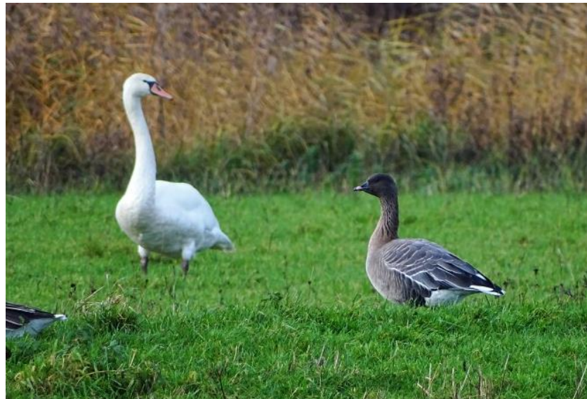
Foto 25 Een kleine rietgans werd gezien in het Waalbos en vermoedelijk hetzelfde exemplaar later in de Zegenpolder

soort gevonden, namelijk een hop in Smitshoek, waar die twee tuinen aandeed. Het exemplaar bleek later helaas onvindbaar. Op 9 december zat een kleine rietgans ter plaatse in het Waalbos in een grote groep grauwe ganzen, wat zomaar hetzelfde individu als de afgelopen winter zou kunnen zijn (foto 25). Vermoedelijk hetzelfde exemplaar zat op 13 december in de Zegenpolder, waar toen tevens twee toendrarietganzen aanwezig waren. In de Crezéepolder