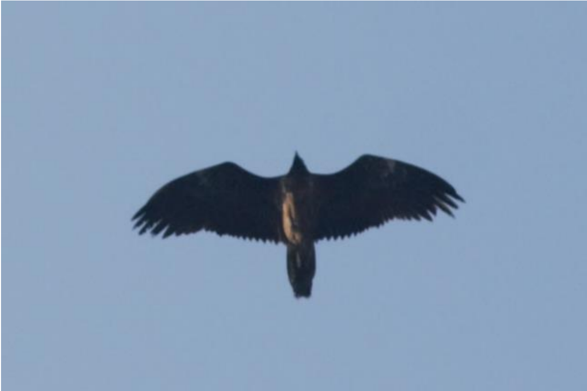
Foto 5 Lammergier over Bos Valckesteijn op 7 maart.

geen ringen of gebleekte pennen, dus groot was de vreugde toen hij ook over Pernis en Bos Valckesteijn kwam (foto 5). Daarna verdween hij uit beeld, om de volgende dag, na vermoedelijk geslapen te hebben in het Klein Profijt, over het eiland richting het oosten vloog om bij de Sophiapolder over te steken richting de Alblasserwaard. Na dit geval werd de 'inheemse' status van deze soort op de Nederlandse lijst opgeheven en de vraag is nu of het een echt wild exemplaar betreft of niet. Een indrukwekkend gezicht voor de gelukkige waarnemers was het in ieder geval. De zeearenden als meer 'gebruikelijke' indrukwekkende vogels van IJsselmonde verschenen ook weer meermaals, namelijk een cirkelend paar boven Zwijndrecht op 27 maart en een individuele vogel op 30 maart over de Veerplaat. Zeer waarschijnlijk betreffen dit vogels uit de Biesbosch. Andere leuke roofvogelwaarnemingen waren nog een rode wouw over Slikkerveer op 26 maart, een smelleken op 12 maart over de Gorzen en op de 31 ste in Waalbos en een man blauwe kiekendief op 27 maart, jagend bij de Devel. De