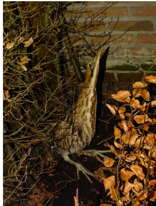
Foto 4 Roerdomp in een klein achtertuintje in H.I.Ambacht